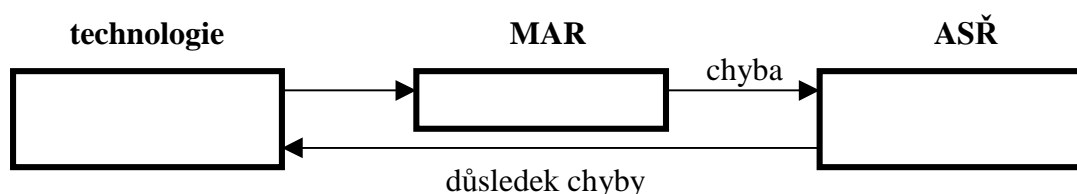
Obr.1. Působení chyby vzniklé v MAR

Zvláštní pozornost zasluhuje návaznost souboru MAR na předcházející a následující část projektu. Pro správnou funkci všech prostředků MAR, v první řadě čidel a analyzátorů, je nezbytné jejich správné začlenění do provozních technologických souborů. V opačném případě dochází k situaci znázorněné na obr.1.